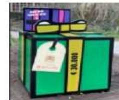
dec-20 voorbereiding Wijkdo wijkbudget