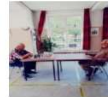
jul-20 kleinschalige activiteiten met maatregelen