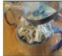
mei-20 redactie Wijkwijs in het zonnetje