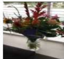
sep-20 welkomstbloemen voor de wethouder