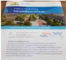
jun-20 start werkzaamheden Goudsbloemlaan