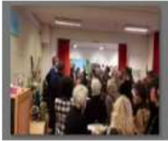
jan-20 nieuwjaarsreceptie samen met de bomenbuurt