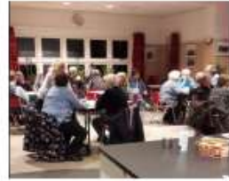
jan-20 thema-avond gemeente Wijkagenda in Wijkcentrum