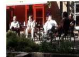
sep-20 politiek debat op de duurzaamheidsdag