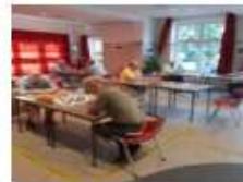
aug-20 activiteiten op veilige afstand in het Wijkcentrum