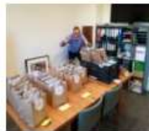
dec-20 voor alle vrijwilligers een tasje