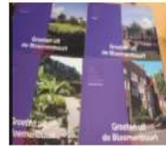
apr-20 alle ondernemers in de buurt krijgen een hart onder de riem d.m.v. een kaartje