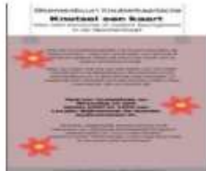
apr-20 knutsel actie voor de oudere buurtbewoner