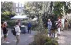
sep-20 duurzaamheids wijkfestival Wijkcentrum